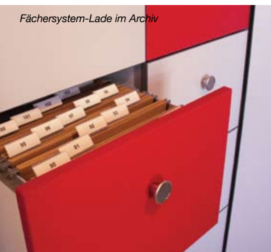
Fächersystem-Lade im Archiv