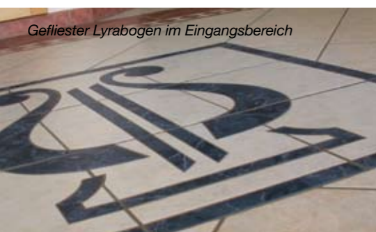
Gefliester Lyrabogen im Eingangsbereich