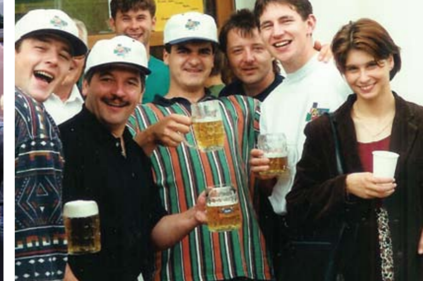
Ausflüge gehören zum Vereinsleben einfach dazu, weil sie die Kameradschaft fördern. Links: Ausflug nach Bled (Slowenien) 2005; Rechts: Prutz (Tirol) 1996