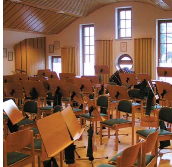
Proberaum im Obergeschoß