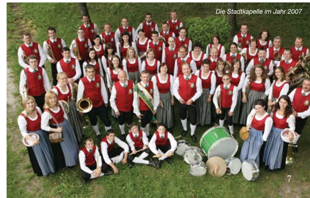
Die Stadtkapelle im Jahr 2007