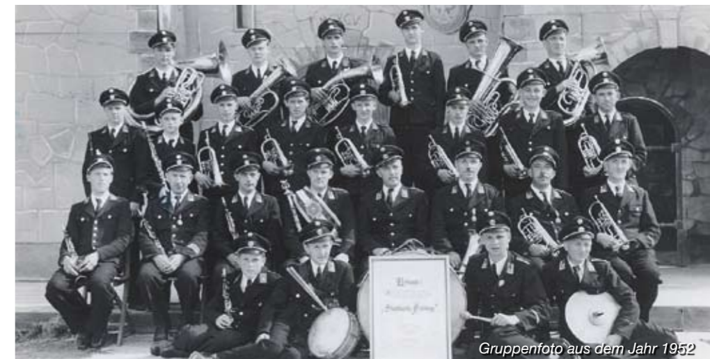
Gruppenfoto aus dem Jahr 1952

Dass Blasmusikkapellen selbstständige Institutionen gesellschaftlichen Lebens sind, ist oft erst einer späteren Entwicklung/Emanzipierung zu verdanken. Eine Musikkapelle ist und bleibt aber, auch wenn dabei das Wort „Tradition“ mitschwingt, immer eine moderne Institution, die sich der „musikwertebewahrenden“ Aufgabe verschrieben hat.