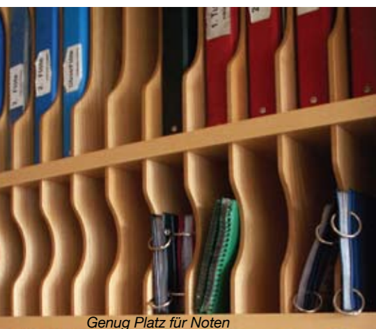
Genug Platz für Noten

Drehen wir das Rad der Zeit kurz zurück: Das erste „alte“ Musikheim befand sich hinter der Friedberger Volksschule. Erbaut wurde es bereits im Jahr 1961 und als Probelokal erfüllte es bis ins Jahr 2001 seinen Zweck. Vor allem aufgrund der steigenden Mitgliederzahl, aber auch aus akustischen Gründen wurde es notwendig ein neues Probelokal zu errichten.